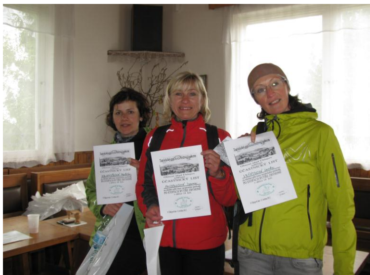
Fotografie z turistického pochodu „Po stopách rytíře Zbyhoně“

Úhlejský zpravodaj vydává Obecní úřad Úhlejev Grafické a technické zpracování : Petr Valenta