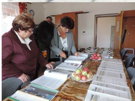
Úhlejevský zpravodaj vydává Obecní úřad Úhlejev Grafické a technické zpracování : Petr Valenta