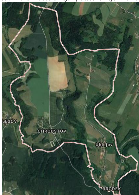
Obrázek 2 – katastrální území obce Úhlejev (katastr Úhlejev a Chroustov)

Hospodaření obce se vztahuje převážně na využívání energetických zdrojů, zástavbu a nakládání s odpady. Zastavěná plocha současných obou katastrů obce Úhlejev (Úhlejev a Chroustov) je přibližně 5,5 ha. Do centrální části obce Úhlejev, v pásu podél páteřní komunikace III. tř. (č.28449 – viz. obr. č. 4) a do úzkého pruhu zv. Brodek, jsou soustředěny převážně plochy pro bydlení. V Chroustově jsou pak tyto plochy po obou stranách druhé hlavní komunikace III. tř. (č. 28447 – viz. obr. č. 5) vedoucí z Miletína na Zvičinu. Dále jsou zde oddělené lokality bydlení Růžovka a Horní Mlýn. Důležitou součástí místní zástavby je lokalita chatové osady mezi Chroustovem a osadou Růžovka.