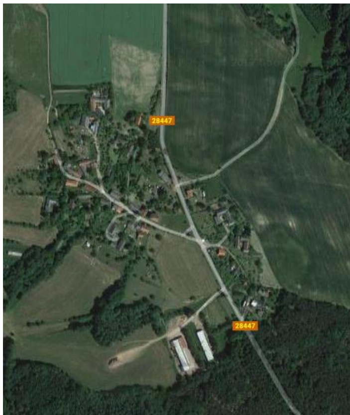
Obrázek 4- Osada Chroustov – letecký snímek