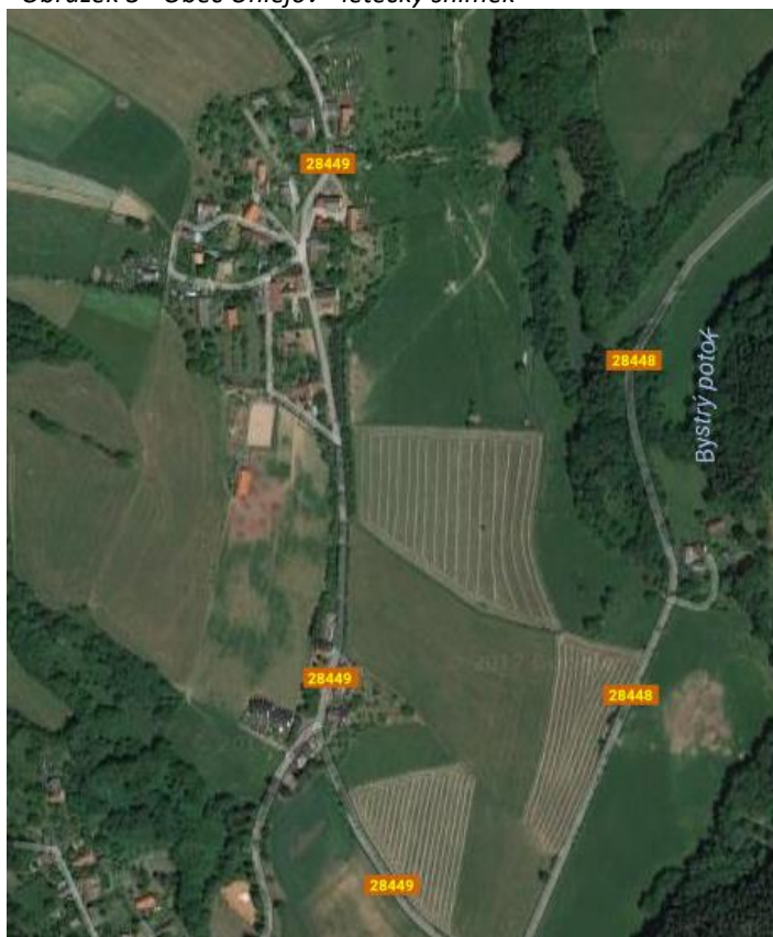
Obrázek 3 - Obec Úhlejev - letecký snímek